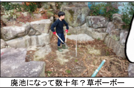
廃池になって数十年？草ボーボー