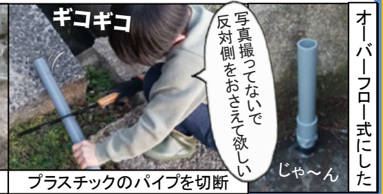
プラスチックのパイプを切断