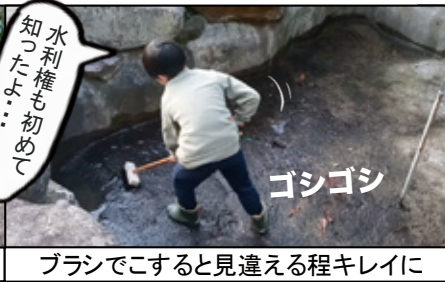
ブラシでこすると見違える程キレイに