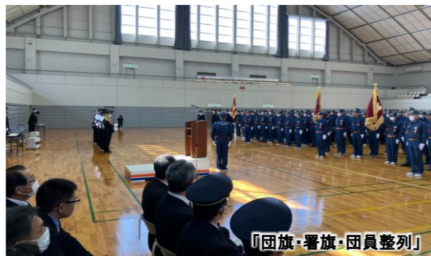
「団旗・警旗・団員整列」

状況や事情によっては、避難所に行かない「おうち避難」も言われるようになりました。そのためには、避難時の「防災リュック」の用意とあわせて、最低限必要なものを家族で準備する「おうち備蓄」のすすめが語られます。これまでは、目安として「3日分」でしたが、現在では、大規模な災害に備えて「7日分」の確保が推奨されています。「目安＝家族の人数×7日分」。飲料水、主食、缶詰・瓶詰、レトルト食品・フリーズドライなどです。とくに、水はひとりあたり1日3リットルを目安に。また、簡易トイレなども言われます。