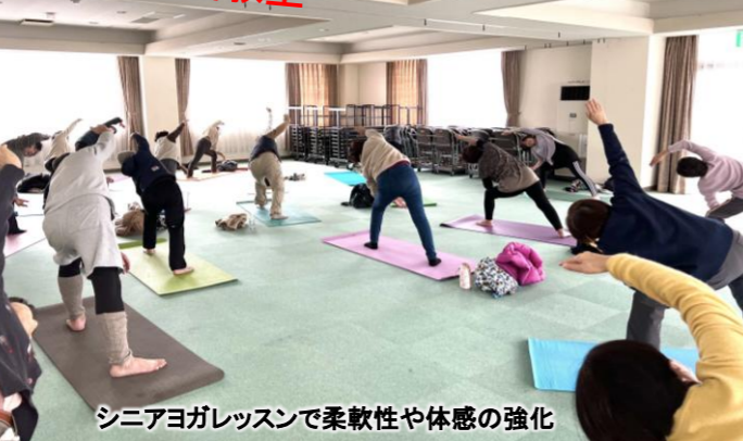
シニアヨガレッスンで柔軟性や体感の強化