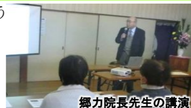
郷力院長先生の講演