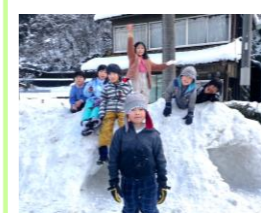
かまくらも作りました

降り積もった雪も残り、寒空の下でしたが、こどもたちは、点火して燃え上がったやぐらで温まり、とんど焼きの火で焼いたお餅やマシュマロチョコレートをいただいたりして、エネルギー満タン。竹のはじける音に驚きながら、舞い上がった灰を追いかけたり、かまくらを使った雪遊びに夢中