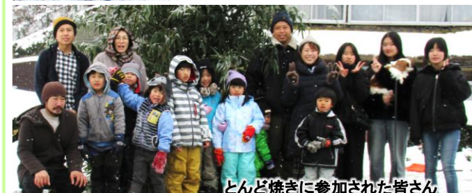
とんど焼きに参加された皆さん