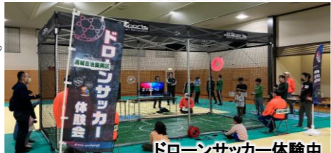
ドローンサッカー体験中