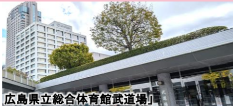
広島県立総合体育館武道場