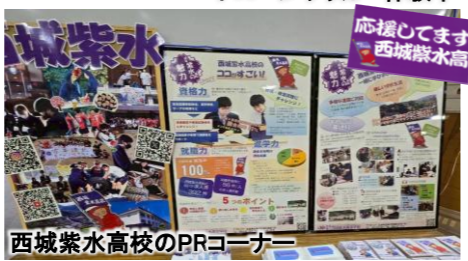
西城紫水高校のPRコーナー