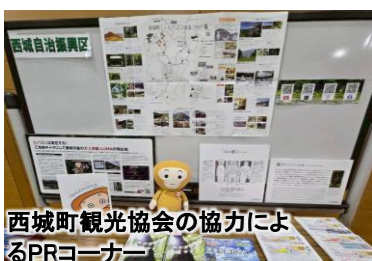
西城町観光協会の協力によるPRコーナー

午後1時から3時間、50人がドローンサッカーを体験しました。ドローンボールがゴールするたび歓声が上がります。参加者の皆さんに喜んでいただけたと自負しています。今回の体験会は西城から広島までの移動もあり大変でした。多くの関係者の皆様のご協力で体験会は事故もなく終えて大成功でした。帰路、西城のスタッフは笑顔でした。