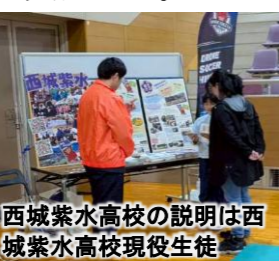
西城紫水高校の説明は西城紫水高校現役生徒