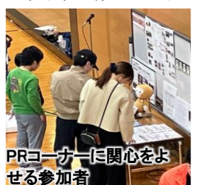
PRコーナーに関心をよせる参加者