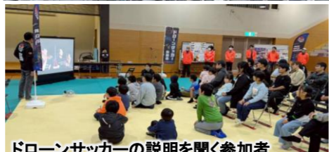
ドローンサッカーの説明を聞く参加者