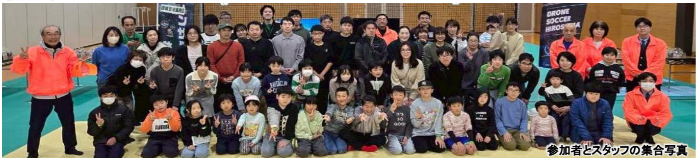
参加者とスタッフの集合写真