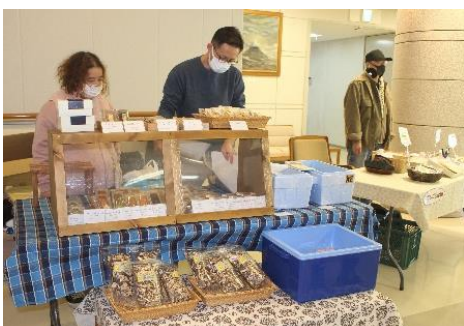
さくら学園 青空 就労支援 せせらぎ