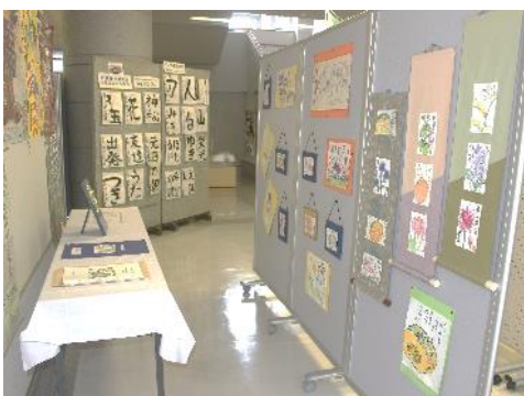
絵手紙の会/子ども絵手紙教室