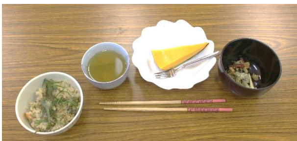
味噌玉にお湯を注ぐと簡単にみそ汁ができます

比和自治振興センター(図書館・博物館)は12月29日(日)~1月4日(土)まで休館です。