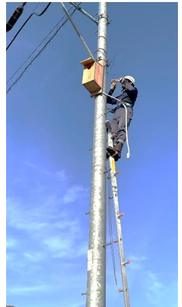
森繁さんが巣箱を設置しています