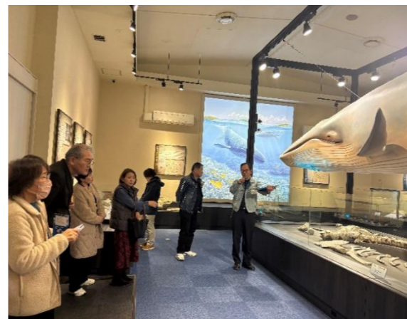
▲比和自然科学博物館を見学

2月27日、比和自治振興センターにて庄原の自治振興センター職員を対象に、専門性の向上や情報交換を図る事を目的とした、研修会と交流会が行われました。