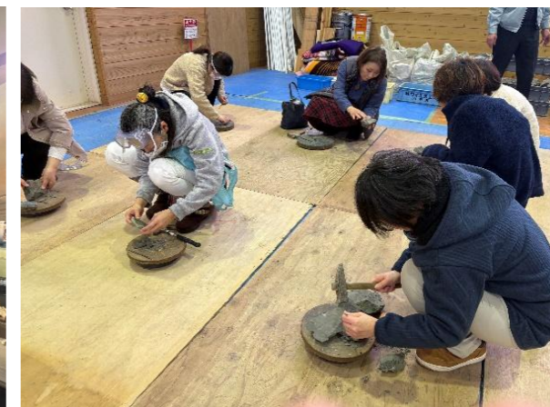
▲化石ミニ発掘体験の様子