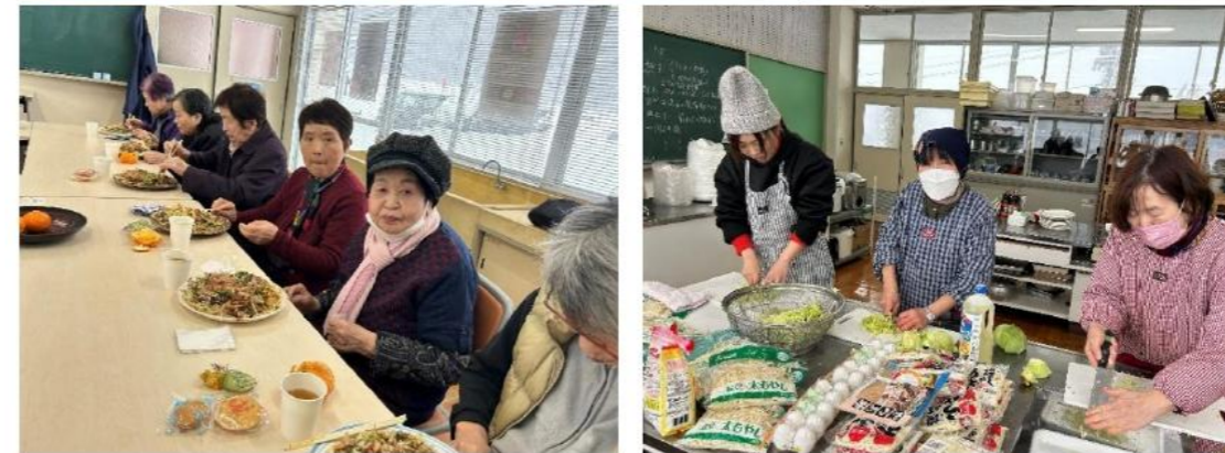
調理参加の方が作られたお好み焼きを、皆で美味しくいただきましたよ(^_^)/

2/19(水) 下高自治振興センターで『きらく食堂2月会』を実施しました。今回は『おでかけワゴン』の運行時刻が改正になってはじめての回です。高暮、上里原、下門田、岡大内から9時の便を利用して12名が集まってくさいました。当日は大雪にもかかわらず、高野交通さんが参加者の自宅までお迎えをしてくれ、参加者からは「大雪のなか来てくれた。ベテランの運転手さんなので安心して乗っておられる」といった声が聞かれました。会では、認知症に関するDVDを見たり、歌を歌って過ごしました。今回も調理参加の方が「うどん入りのお好み焼き」を作って下さり、町内からこのお好み焼きの配達を申し込みされる方も多くおられ人気広がっているなど感じています。