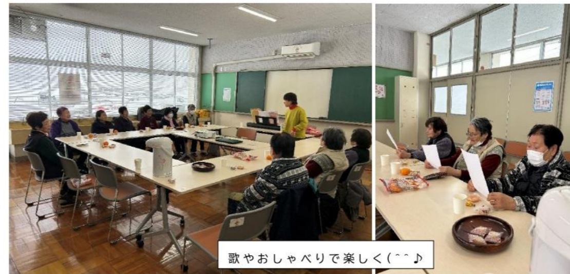
歌やおしゃべりで楽しく(^_^)

“おでかけわゴン” を利用して気軽に集まる 『2月会』 に12名が参加されました